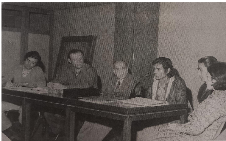
Los integrantes de la Comisión Interna de IDEAL - ARCOR exponen en el plenario del Sindicato de Luz y Fuerza presidido por Agustín Tosco en julio de 1974.

En sus seis capítulos el libro propone un recorrido por documentos, pronunciamientos e historias que permiten mostrar el impacto de las grandes movilizaciones callejeras obrero-estudiantiles dentro de los establecimientos laborales, permitiendo reconstruir muchos de los circuitos y correas de transmisión entre el adentro y el afuera de la fábrica. Un eje conductor del libro es el papel de los delegados/as y la comisión interna tanto en la organización en el lugar de trabajo como en las articulaciones con fábricas de otras actividades y con los procesos más amplios de disputa local, regional, nacional e internacional. Al mismo tiempo, resulta muy interesante el entrecruzamiento de la historia de la organización sindical y laboral con la evolución de la empresa, el análisis de las estructuras y conexiones empresariales y sus distintas etapas. En este marco, el libro muestra que IDEAL-ARCOR era el establecimiento gráfico más grande de la provincia de Córdoba y del interior del país.