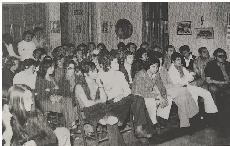
Asamblea de IDEAL - ARCOR en la Unión Obrera Gráfica de Córdoba.

El libro muestra cómo, después del 24 de marzo, en medio de la represión al movimiento sindical, a las organizaciones políticas, armadas, sociales opositoras se desplegó una ofensiva contra los trabajadores que incluyó profundos recortes en los derechos laborales y sindicales y drásticas transformaciones económicas, en combinación con un despliegue represivo de una intensidad inédita hasta el momento, incluso en un territorio en el cual la represión había ido avanzando en esa etapa.