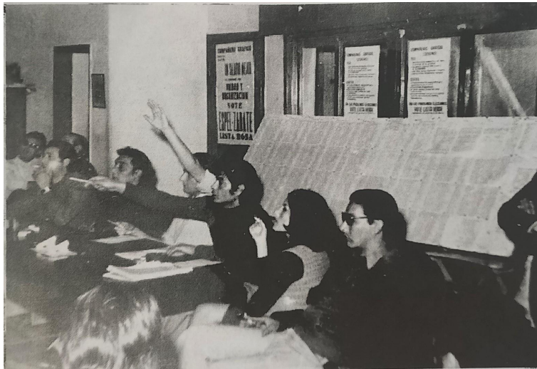
Asamblea de IDEAL - ARCOR en la Unión Obrera Gráfica de Córdoba.

la actividad gremial en la planta se acomoda una resistencia a la autoridad patronal, teñida por una necesidad económica y también por una actitud de resistencia en el 76 y 77, cuando a pesar de la intensidad represiva y el miedo se presentaron notas y petitorios. "Si bien habían arrasado todos los derechos y formalmente no estaba ya la Comisión Interna, sus integrantes, controlados, inmovilizados en los puestos de trabajo y no exentos de actitudes revanchistas, el personal de planta en las diferentes secciones se fue juntando y sintetizando, de esa manera propia que tienen los trabajadores, las necesidades del momento."