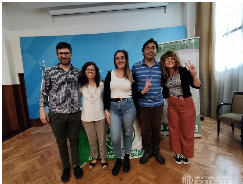
Equipo de CIFRA con la Junta Interna del Ministerio de Desarrollo Social

con compromiso político, buscando incidir en el debate público y aportar herramientas para la acción sindical.