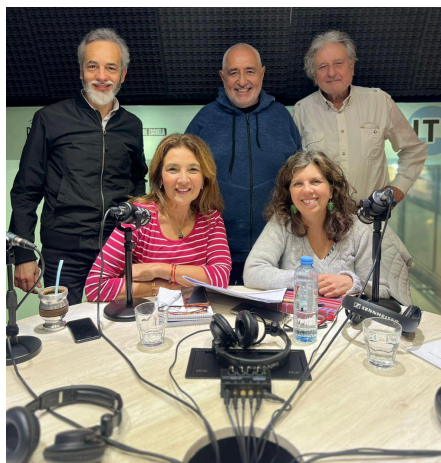
CIFRA en Radio UTE

CIFRA publica regularmente un informe de coyuntura, que se orienta a brindar una caracterización sintética de la situación económica argentina. Los informes incluyen un análisis de la actividad económica, la dinámica de los precios, la situación del sector externo, la política económica y su impacto sobre el mercado de trabajo y los salarios en el corto plazo.