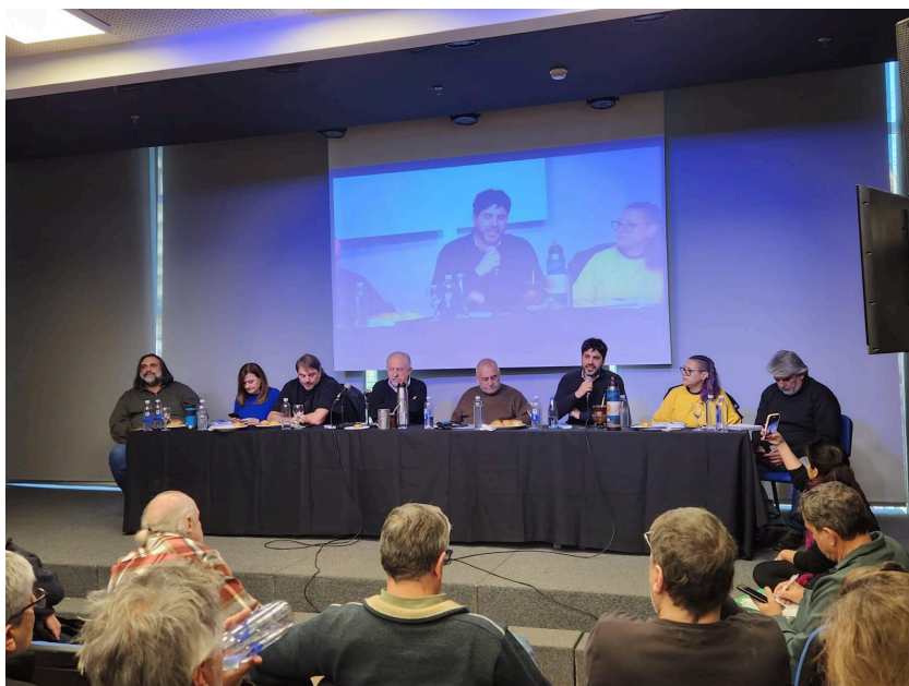
CIFRA en un homenaje a Eduardo Basualdo

Desde ese momento ha tenido continuidad en su funcionamiento, con una estructura reducida pero comprometida con la tarea de brindar información y análisis económicos que puedan ser de utilidad a las y los trabajadores y, más en general, al debate público en torno a las problemáticas económicas, laborales y sociales.