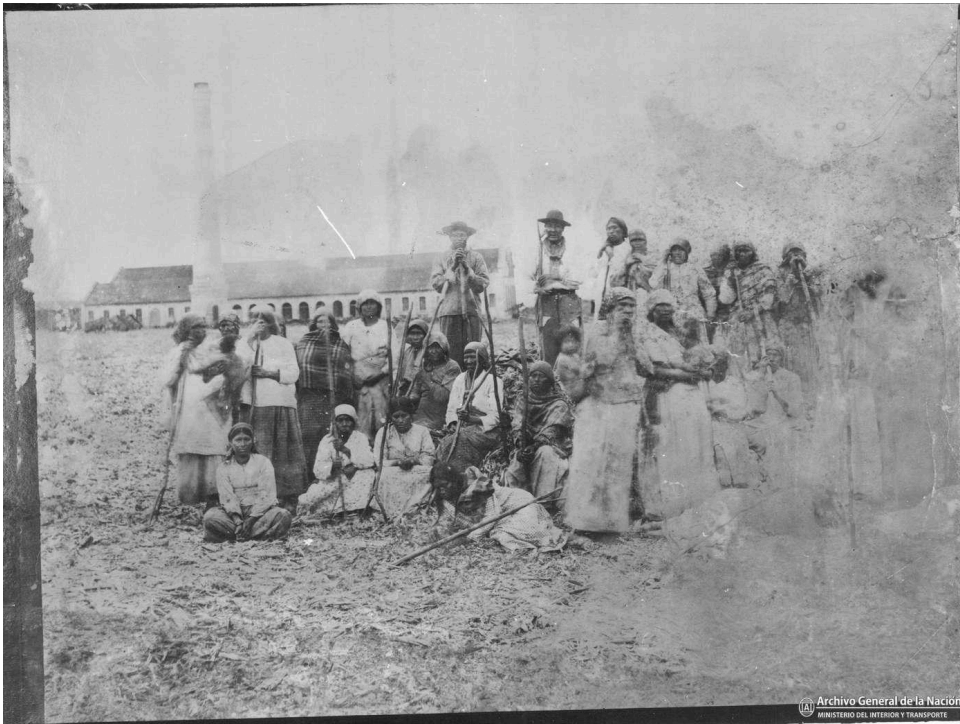
"Indios de un ingenio en Tucumán".

Que no viva la gente [nivaçle] de balde, dice. De balde el indígena porque no sabe nada, no sabe trabajar la tierra, así dice, yo escuchaba antes. Así que querían terminar todo. Quería terminar a todos los indígenas que no saben trabajar. Quiere quitar la tierra el blanco. Vivir acá todo. Por eso mezquina la gente [nivaçle] antes la tierra. Por eso es que la gente [nivaçle] está peleando por la tierra. Eso contaba papá antes (comunidad La Media Luna 2016).