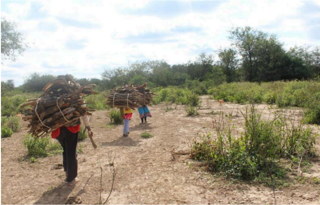
Cargando leña en el territorio Nivaçle.

Más allá de la persistente explotación económica, la continuidad de la violencia hacia los pueblos indígenas se expresa de múltiples maneras, porque aunque los Nivaçle fueron incorporados como trabajadores y aportaron con su fuerza de trabajo al desarrollo productivo del país, ese mismo Estado que los necesitó ha negado sistemáticamente su reconocimiento pleno como un pueblo preexistente, con derechos sobre sus territorios y respeto a sus formas de vida.