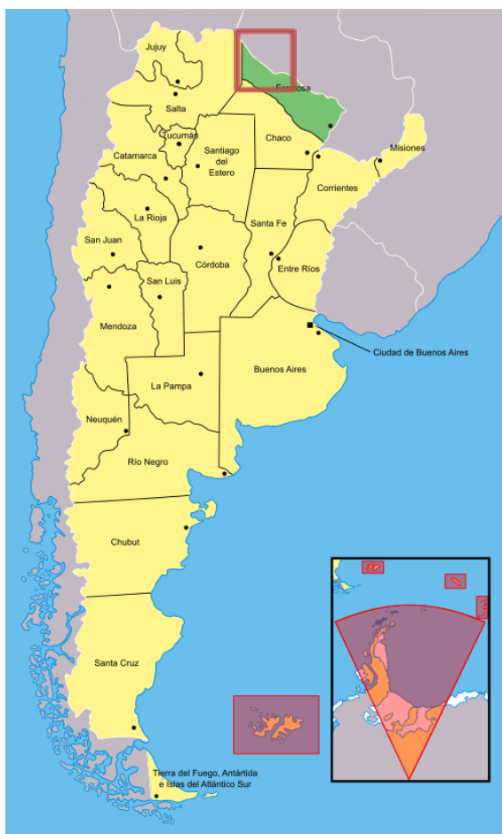
Mapa 2. Localización del área de estudio: provincia de Formosa, Argentina.

comunidad San José de Esteros en el departamento de Boquerón (Paraguay) (ver Mapa 1 y 2).