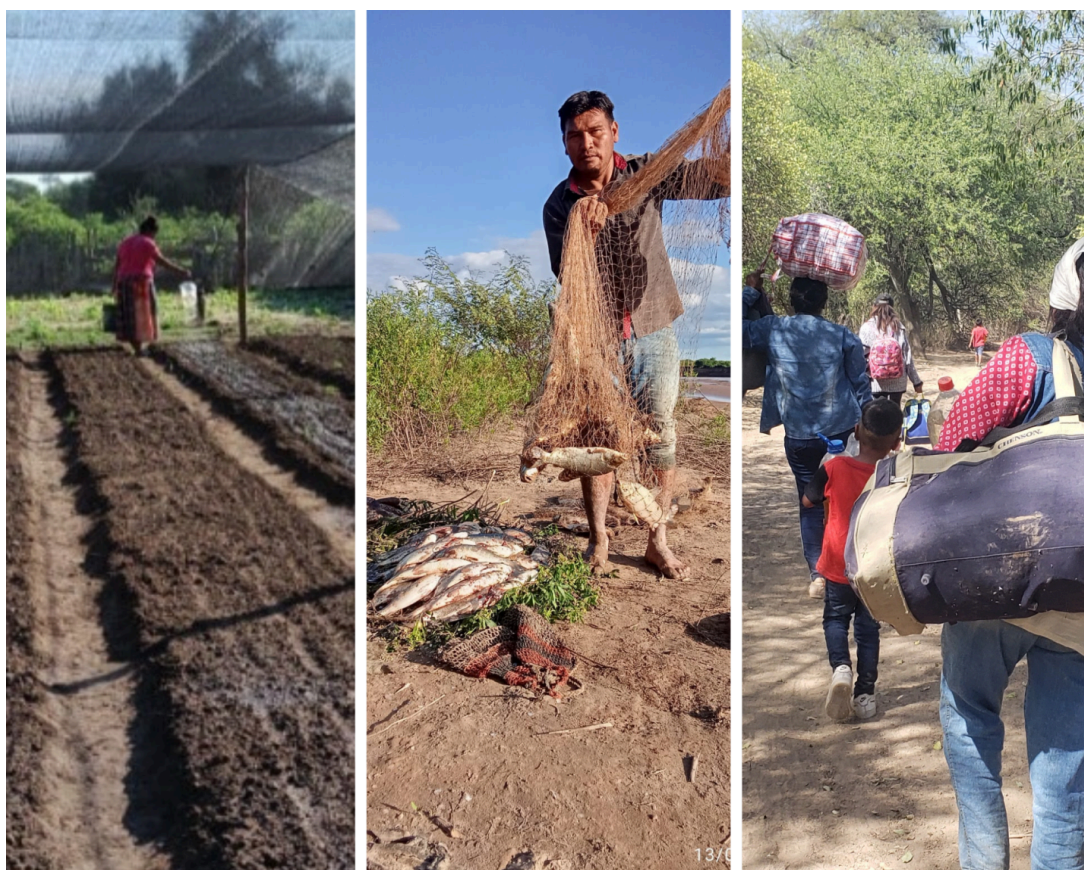
Movilidad y trabajo nivaçle.

Antes de la colonización, los nivaçle "no tenían paradero", es decir que no vivían concentrados en un solo lugar, o no tenían una residencia fija. Se desplazaban según las estaciones, las lluvias, la disponibilidad de alimentos y las relaciones entre grupos familiares. El río Pilcomayo, el monte, las lagunas y los bañados formaban parte de un amplio territorio, recorrido y conocido.