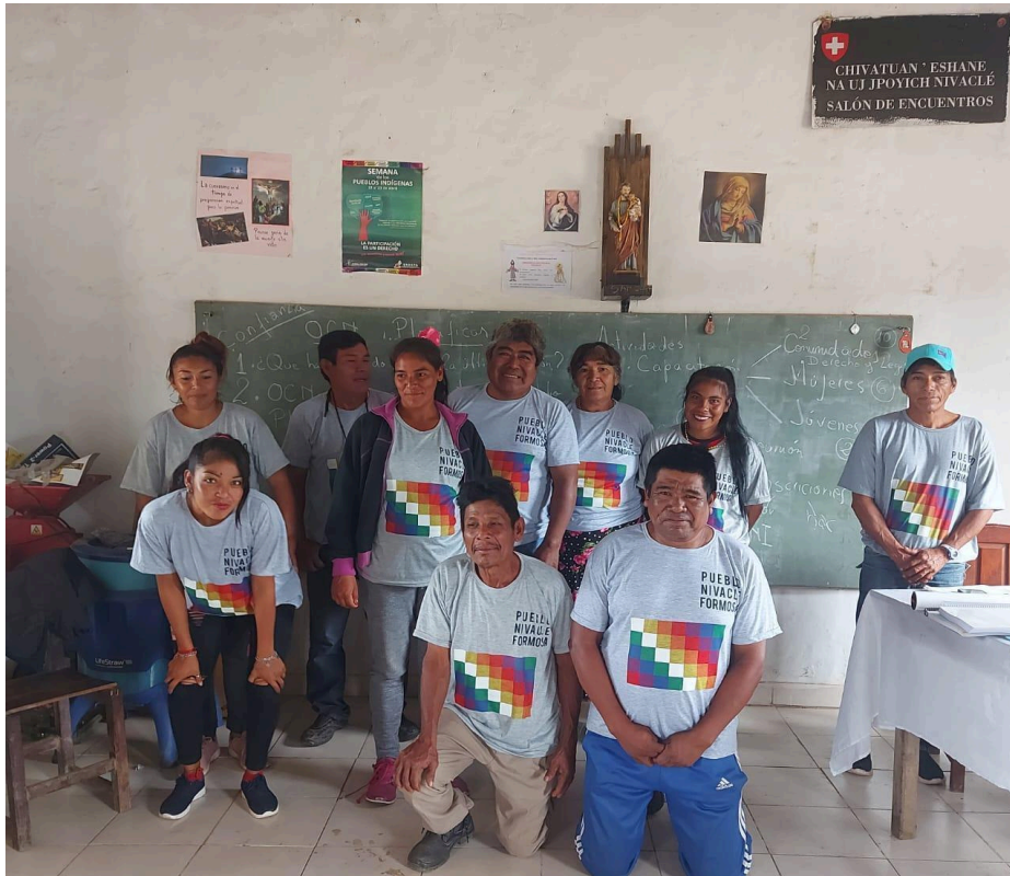
Referentes de las comunidades Nivaële de Formosa, San José, 2023.

En este contexto, la precarización del trabajo no puede separarse del despojo territorial ni de la negación de derechos. Las changas, los trabajos mal pagos, la dependencia de programas sociales, no son simplemente "falta de empleo": son parte de una larga historia de subordinación.