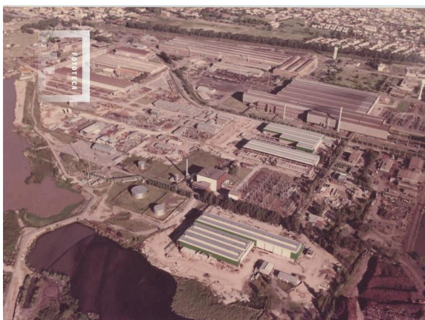
Vista aérea del complejo siderúrgico Dálmine-Siderca, en Campana, lindante al Río Paraná.

caso paradigmático de los astilleros Astarsa, en el que, por medio de la Comisión Obrera de Control de Higiene y Seguridad desde 1973 los trabajadores pudieron fijar condiciones para las diferentes tareas realizando reconocimientos médicos integrales del personal y estudios sistemáticos de salubridad, establecieron una reducción del horario laboral manteniendo el salario, fijaron nuevas normas de seguridad, declararon insalubres determinadas tareas, supervisaron los resultados de las mediciones ambientales y los nuevos métodos de trabajo antes de su implementación; incorporaron trabajadores tercerizados a planta permanente con las mismas condiciones laborales, y lograron una reducción drástica de los “accidentes laborales” (Sosa, 2023).