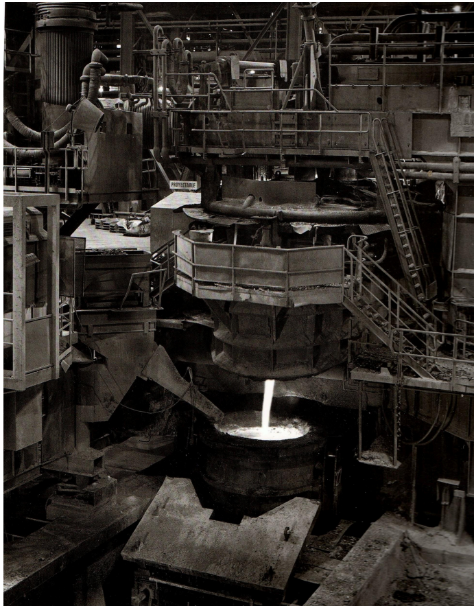
Colada de uno de los hornos eléctricos en la acería.

consecuencia que todos los trabajadores que se desempeñaban allí vieran reducida su jornada laboral a seis horas diarias, con el mismo salario, la prohibición de realizar horas extras, la obtención de un régimen jubilatorio especial, la creación de un nuevo turno de trabajo en la sección y un aumento inmediato en el número de trabajadores directos contratados. El régimen de insalubridad convivió contradictoriamente durante el período con formas de monetización de la salud obrera que el sindicato y la patronal negociaron en actas internas, como los premios por producción y productividad.