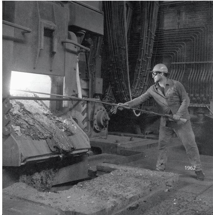
Trabajador cargando un horno de la Acería de DS, en 1962.

seguían ese régimen laboral por la determinación empresarial de aprovechar al máximo la maquinaria y aumentar así la valorización del capital. Por lo pronto, según ha sido demostrado en distintos estudios a nivel internacional, el trabajo en turnos con rotación implica severas cargas fisiológicas y psíquicas, incluyendo trastornos digestivos como úlceras, tensión nerviosa prolongada, insomnio, fatiga patológica y elevados índices de mortalidad por infarto, entre otras patologías. Durante la jornada, los trabajadores se exponían además a numerosos riesgos ambientales, químicos y sonoros, que se constituían como cargas laborales: el polvillo acumulado en los rieles, los humos y las altas temperaturas en el área de fundición, el ruido en los hornos, la continua tensión nerviosa