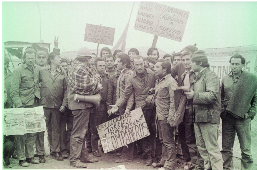
Trabajadores del astillero Astarsa durante la toma de 1973, en reclamo contra las muertes obreras y la insalubridad laboral.

llevada adelante por el nuevo gobierno peronista, que no permitía la discusión salarial directa. Los conflictos obreros en esa línea determinaron avances, que a nivel general quedaron plasmados en la creación del Instituto de Medicina del Trabajo de la UBA en 1973, en artículos de la Ley de Contrato de Trabajo (LCT) aprobada en 1974, y en el auge histórico en las resoluciones de insalubridad laboral dictadas por el Ministerio de Trabajo durante la etapa, que acortaron de hecho la jornada laboral legal para miles de trabajadorxs.